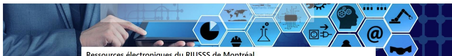
Ressources électroniques du RIUSSS de Montréal

Pour les utilisateurs ne possédant pas de compte Windows ou d'équipements informatiques du CISSS, une procédure est disponible pour se connecter à partir de matériel externe. Nous vous invitons à communiquer avec nous pour soumettre toutes nouvelles ressources pertinentes à cette banque de références, pour du soutien ou de l'assistance en services documentaires à l'adresse suivante : 09.gestiondocumentaire@ssss.gouv.qc.ca .